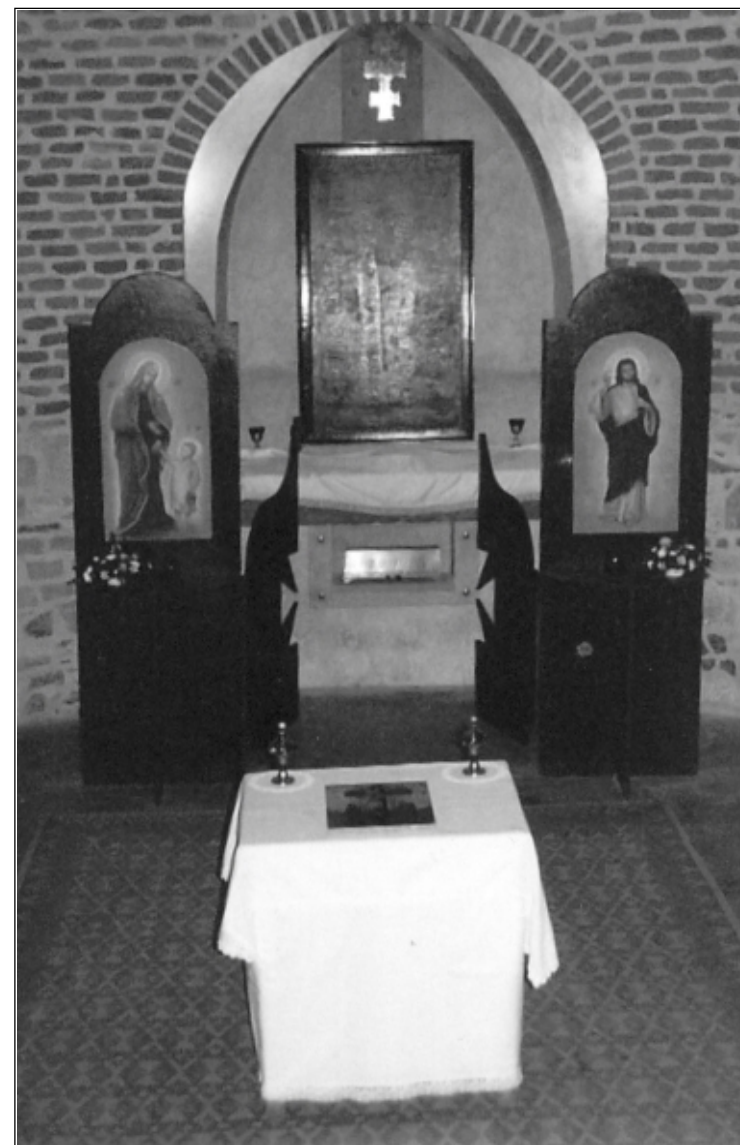
Ostatky sv. Prokopa (pod oltářní menzou)