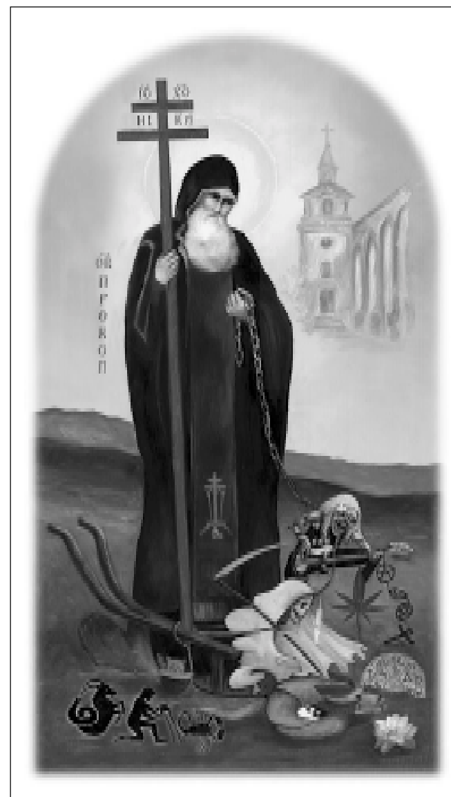
Sv. Prokop, který spoutal a zapřáhl do pluhu mocnosti temna

Na obrázku v pozadí je nedostavěný sázavský chrám, na druhé straně obrázku tato modlitba: