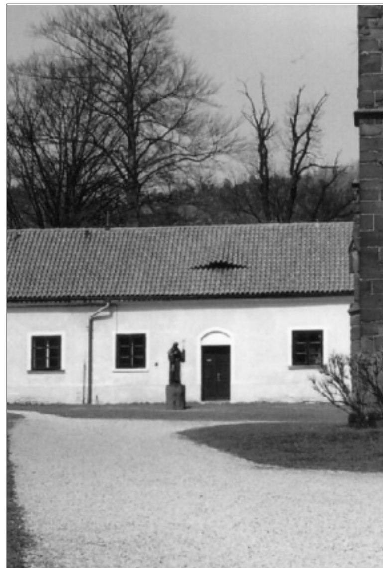
Klášterní nádvoří – pravděpodobné místo uzdravení posedlého člověka

Zatím přibývalo Sázavskému klášteru odpůrců, kteří strojili sv. opatovi různé úklady. Avšak za jeho života nemohly tyto nepřátelské úklady škodit slovanskému klášteru, neboť bohumilého opata chránil a měl v úctě kníže Břetislav. Také jeho druhorozený syn Vratislav choval ke světci velkou úctu. Po dvacet let spravoval Prokop Sázavský klášter, až pocítil, že nadchází konec jeho pozemského života. Podle zjevení Boží milosti se z vnuknutí Ducha Sv. dozvě-